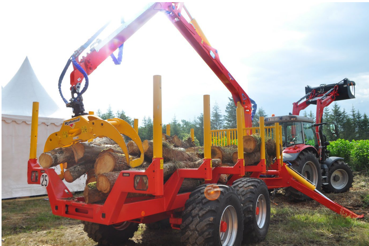
Remorque forestière XYLOTRAIL 18 avec grue de 8 m XYLOGRUE 8 PRO

Remorque et grue forestières aux capacités accrues !